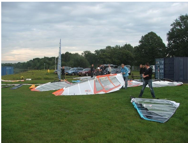
Clubavond voor gevorderden