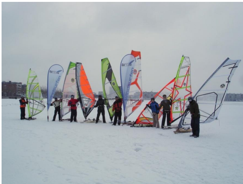
Diverse WSB leden op het ijs van de Binnenschelde, januari 2010