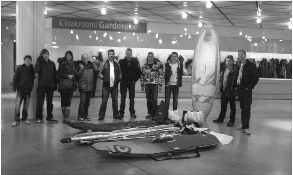
De verzamelde clubleden met de buit van de dag.