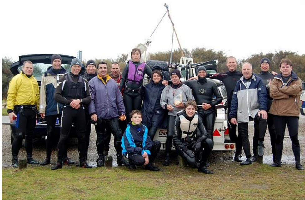
Alle clubleden en de mascotte voor de surfaanhanger.