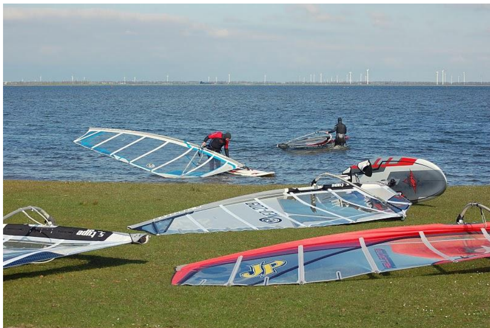
Speeddag 2010 Harderwijk Strand Horst

Voor leden die geen aanhanger hebben is het mogelijk om de clubaanhanger te gebruiken om al het surfmateriaal mee te krijgen. Hier kunnen 12 boards op.